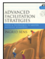
Advanced Facilitation Strategies: Tools & Techniques to Master Difficult Situations