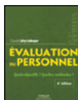
Évaluation du personnel (6e édition)