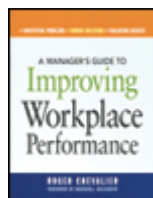
A Manager's Guide to Improving Workplace Performance