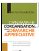
Dynamiser l'organisation avec la démarche appréciative