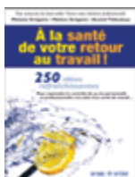
À la santé de votre retour au travail!