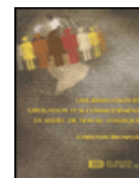
Discrimination et obligation d'accommodement en milieu de travail syndiqué