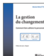
La gestion du changement, comment faire adhérer le personnel